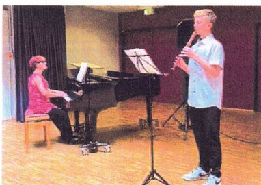
Die Musikschule Rheingau gestaltet beim „Herbstgeflüster“ ein buntes Programm.