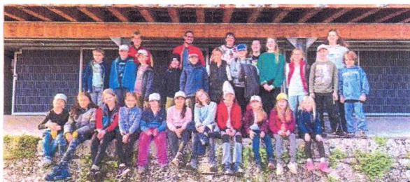
Auf Schatzsuche im Rheingau: die Teilnehmerinnen und Teilnehmer am Kinderzeltlager der DLRG Rheingau in Winkel.