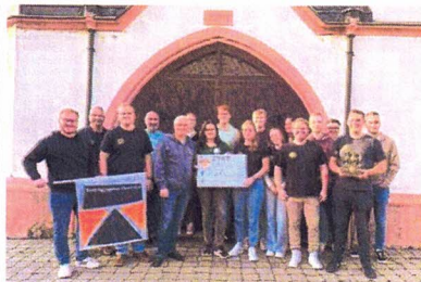
Bierathlon Oestrich spendet 3.100 Euro an „Rheingauer Jugend für Afrika“.