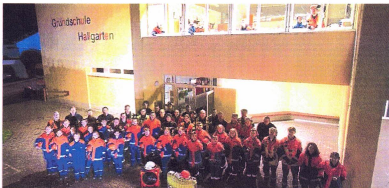
Gemeinsamer Berufsfeuerwehrtag der Jugendfeuerwehren in Oestrich-Winkel.

Die Nassauische Sparkasse (Naspa) unterstützt die Oestrich-Winkler Kita Purzelbaum und deren Förderverein mit 500 Euro bei der Einrichtung der neuen Lesewerkstatt. Das Geld dient der Vervollständigung der